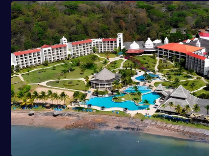
Hotel Dreams Playa Bonita 307 habitaciones

Es un refugio exótico alejado del ruido y bullicio de la ciudad, ubicado en la vasta selva tropical del Parque Nacional Soberanía, a orillas del Río Chagres y del Canal de Panamá. Aquí se combinan la comodidad moderna con la calidez y la fascinante aventura para ofrecer el mejor alojamiento para experimentar la belleza virgen de la selva tropical panameña.