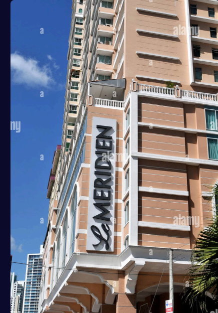
Le Méridien 111 habitaciones

Ubicado en la Avenida Balboa y Calle Federico Boyd, amplias suites con impresionantes vistas al mar y un pintoresco sendero que lleva directamente a la marina, hacen de este hotel el lugar perfecto para ver la entrada de barcos al icónico Canal de Panamá.