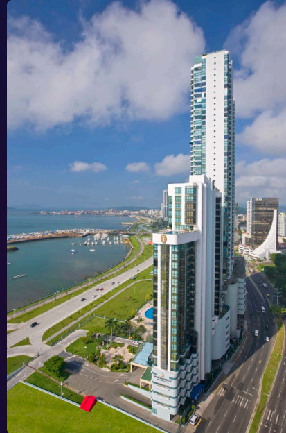
Hotel InterContinental Miramar 186 habitaciones

Goza de una ubicación ideal en Costa del Este a solo 15 minutos del Aeropuerto Internacional de Tocumen, un desarrollo de lujo con oficinas corporativas, proyectos inmobiliarios y áreas recreativas.