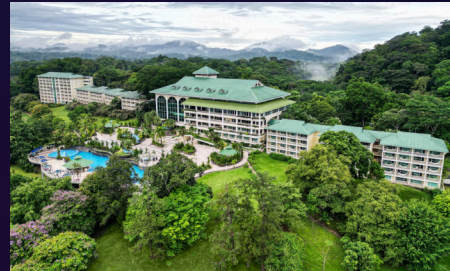
Hotel Gamboa Rainforest Reserve 166 habitaciones

Ubicado a 15 minutos de la ciudad, es un resort de playa con impresionantes vistas panorámicas del Océano Pacífico y el Canal de Panamá. Idealmente diseñado para viajeros de negocios y de placer.