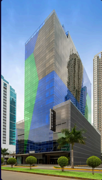
The Westin Panamá 218 habitaciones

Goza de una ubicación ideal en Costa del Este a solo 15 minutos del Aeropuerto Internacional de Tocumen, un desarrollo de lujo con oficinas corporativas, proyectos inmobiliarios y áreas recreativas.