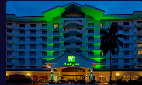
Holiday Inn Ciudad del Saber 137 habitaciones

Es la mejor opción para viajeros de negocios, pues tiene una conveniente ubicación a tan solo cinco minutos del Aeropuerto Internacional de Tocumen y ofrece transporte de cortesía desde y hacia el aeropuerto las 24 horas al día.