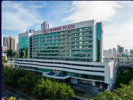
Crowne Plaza Panama 149 habitaciones

InterContinental Miramar | Crowne Plaza Panamá | Holiday Inn Ciudad del Saber | Le Méridien | Crowne Plaza Panama Airport | y The Westin Panama. El portafolio se complementa con el operador turístico Panamazing , ofreciendo una experiencia integral al viajero nacional e internacional.