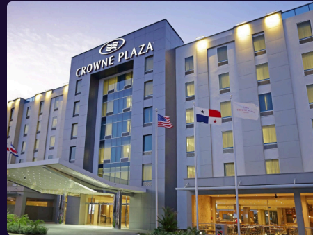
Crowne Plaza Panama Airport 146 habitaciones

Ubicado en el área bancaria de la ciudad y a muy poca distancia de una de las principales estaciones de metro, convirtiéndose en una destacada opción para el viajero de negocios que recorre la ciudad.