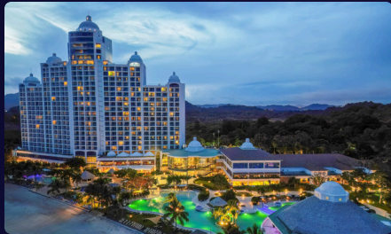
Hotel Westin Playa Bonita 611 habitaciones

Gamboa Rainforest Reserve | Westin Playa Bonita | Dreams Playa Bonita, iconos del turismo panameño.