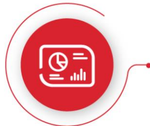
Límites de Inversión