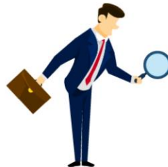
Calificadoras de Riesgo