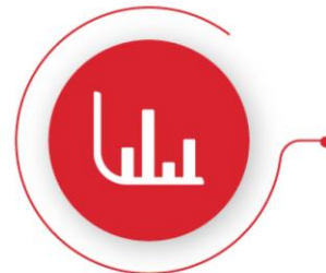
Rendición de Cuentas