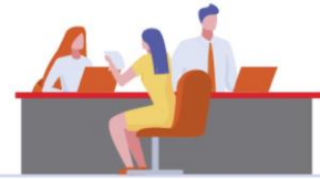
Bolsa de Valores