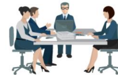
Sociedades Administradoras de Fondos de Inversión