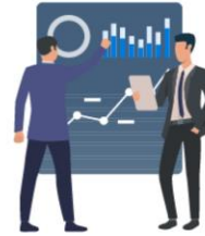
Agencias de Bolsas